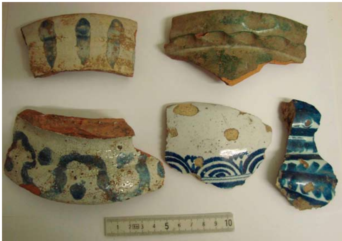
7. Фрагменты садовых ваз

перед строительством. Учитывая идентичность найденных плиток и изразцов, тем, которые сохраняются в интерьерах Летнего дворца Петра I, можно предполагать, что сюда попали строительные материалы, использовавшиеся при возведении одной из каменных построек сада, возможно, построенной незадолго до этого Большой оранжереи. В оранжереях выращивались и сохранялись в зимний период экзотические растения. Летом в специальных горшках и вазах они выставлялись в саду. При раскопках в слое под Малой оранжерей было найдено большое количество садовых ваз (ил. 6).