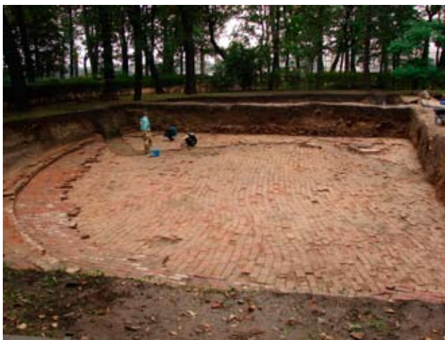
2. Раскопки Менажерийного пруда