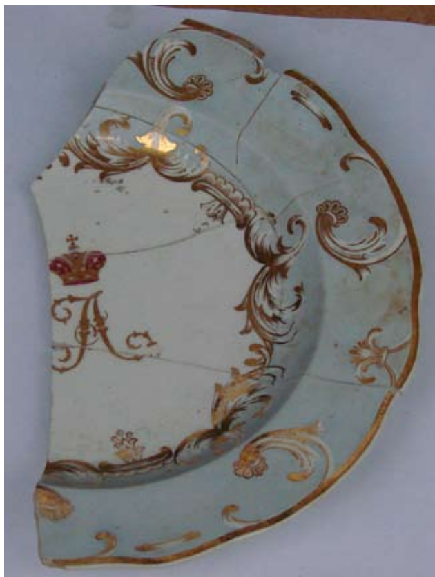
10. Фрагмент тарелки из гербового сервиза