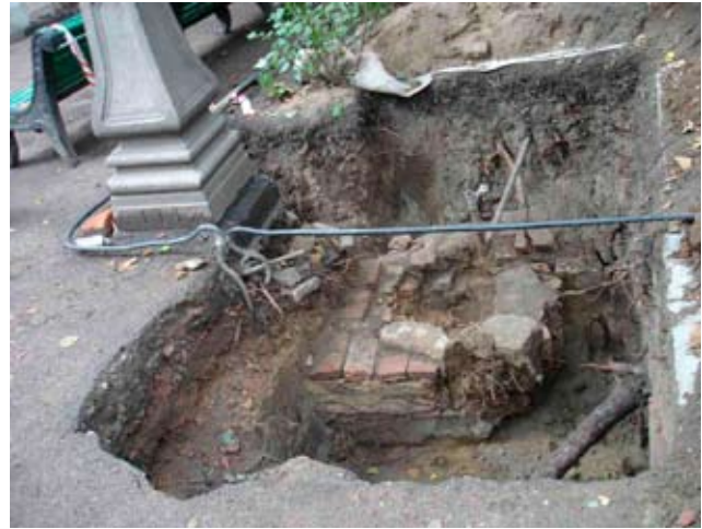
6. Фундаменты садовой скульптуры

магистральных труб, проходивших через основание фонтана. В кладке дна чаши были выявлены каналы для труб. В некоторых из них сохранились фрагменты магистральных чугунных трубопроводов и свинцовых труб, обеспечивавших подачу воды к струям. К фонтану примыкали два дренажных колодца прямоугольной формы (ил. 4).