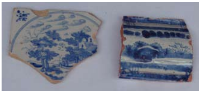
9. Фарфоровая посуда и голландская трубка