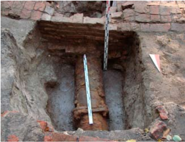
5. Чугунная труба у фонтана на Царицыной площадке