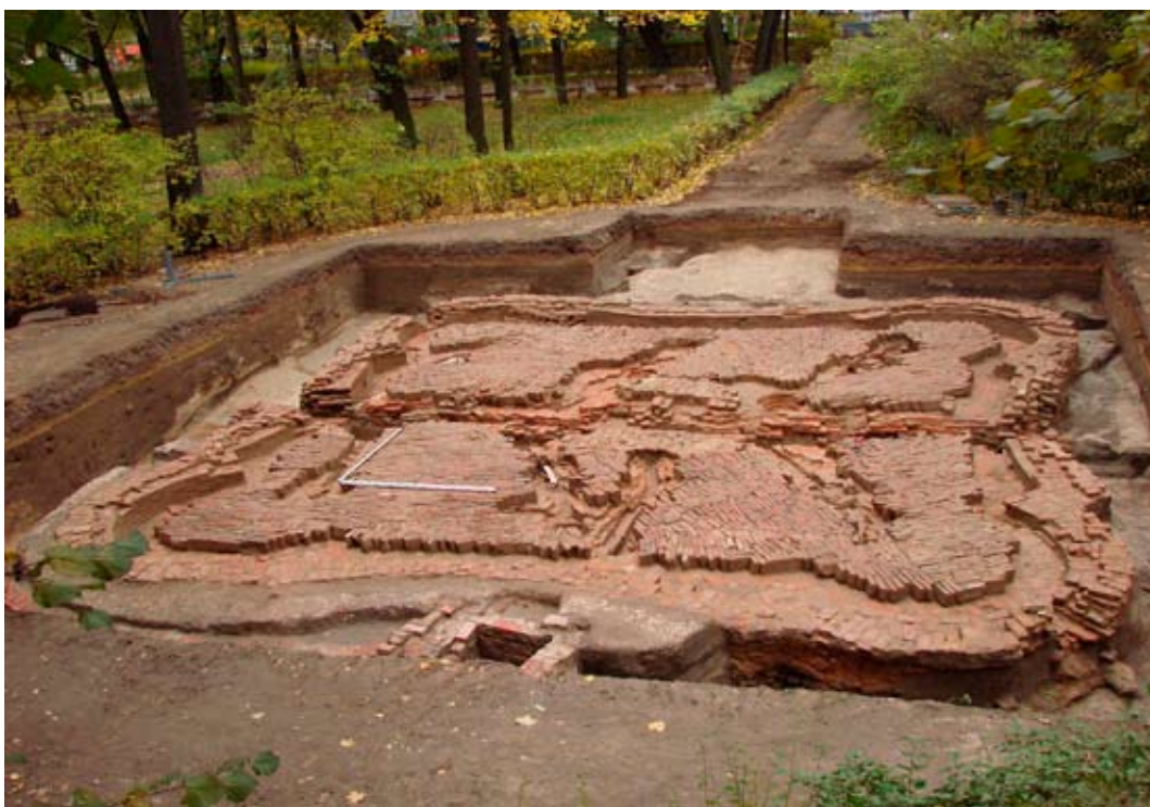
4. Гербовый фонтан

«Гербовый фонтан» располагался на так называемой Шкиперской площадке – второй от Невы. Название он получил от украшавшей его скульптуры двуглавого орла. Фонтан был сделан в форме многоугольника со скругленными углами и вогнутыми сторонами. Кирпичная чаша фонтана размером 11,8x12 м опиралась на основание из кирпича и известковых блоков шириной около 7,6 м, заполненное глиной. По краю, вдоль борта фонтана, существовал водосборный желоб шириной до 60 см. Борт шириной 0,65 м сохранился на высоту до 30 см от уровня дна и около 1 м от основания. Вокруг фонтана на песчаной поверхности сохранилась декоративная обсыпка из ракушек. Подводка воды к девяти струям фонтана осуществлялась от