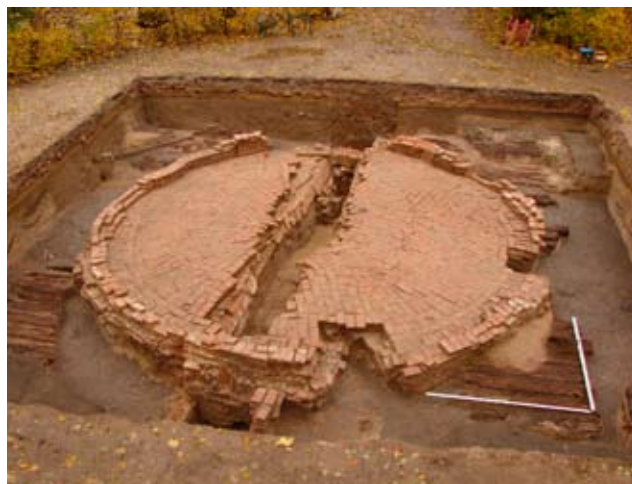
3. Фонтан на Царицыной площадке

аллеи начали строить в 1708 году. Два других фонтана - на второй и четвертой площадках - были построены в начале 1720-х годов.