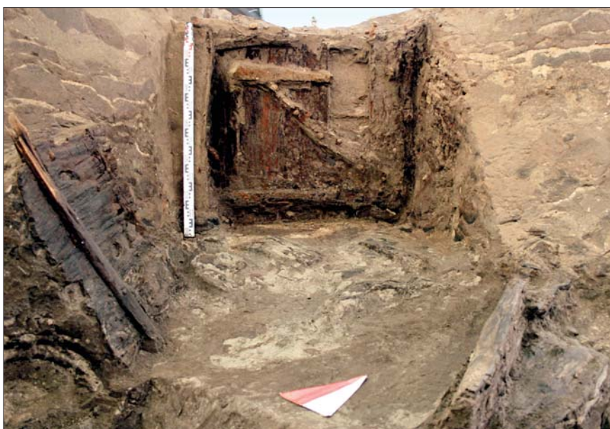
Потайной ход на фланке Мертвого бастиона.

что только в 1615 г. сюда приходили 16 судов из Выборга, Ивангорода, Ладоги, Нарвы, Новгорода, Норчепинга, Ревеля, Стокгольма. Находки, связанные с указанными поселениями XIV–XVI вв., представлены фрагментами керамических сосудов из белой и красной глины.