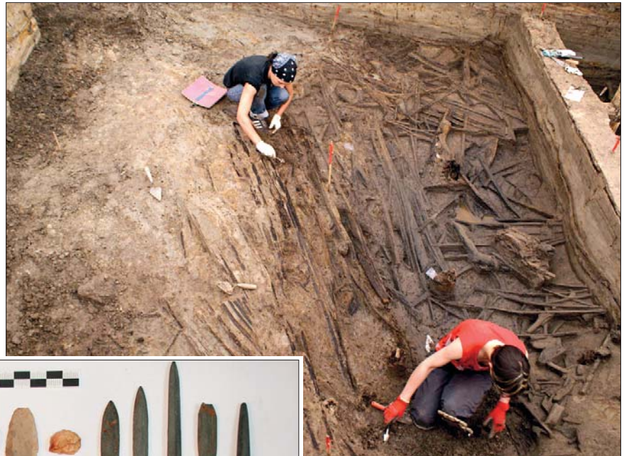
Раскопки деревянных сооружений неолитического времени.