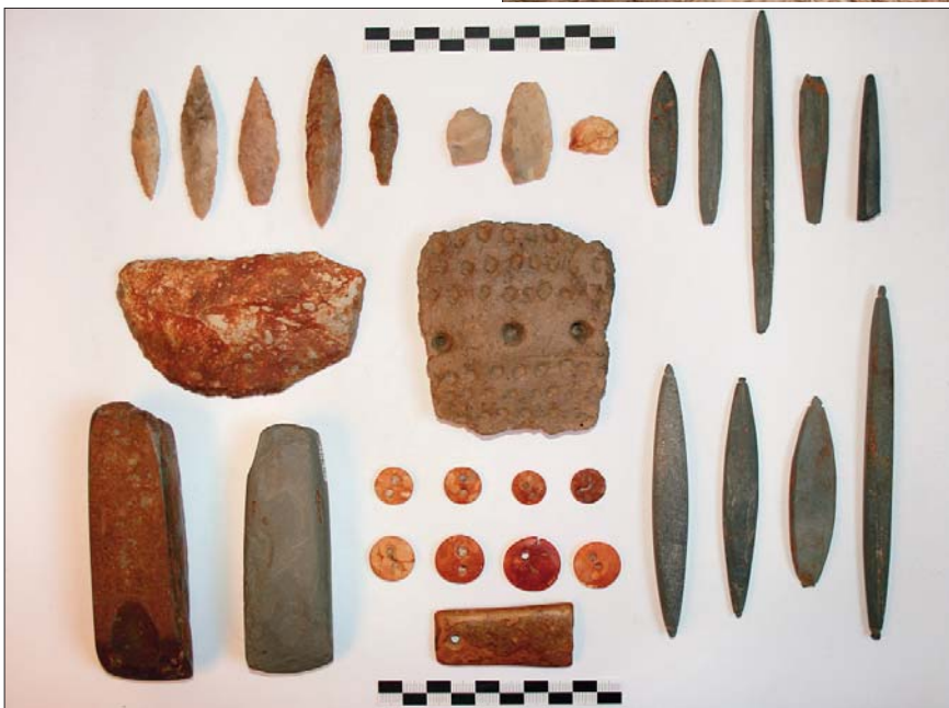
Находки эпохи неолита и раннего металла: каменные орудия, керамика, янтарные украшения.

явилась законодательная основа для продолжения археологического изучения территории. К 300-летию северной столицы на средства российских и шведских меценатов удалось провести мемориализацию памятного места: создать памятный знак, посвященный событиям древности, и открыть первый в Петербурге историко-археологический музей «Ландскрона, Невское устье, Ниеншанц».