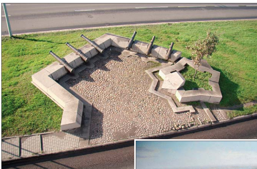
Памятный знак «Крепость Ниеншанц», 2000 г. Авторы Владимир Реппо, Петр Сорокин