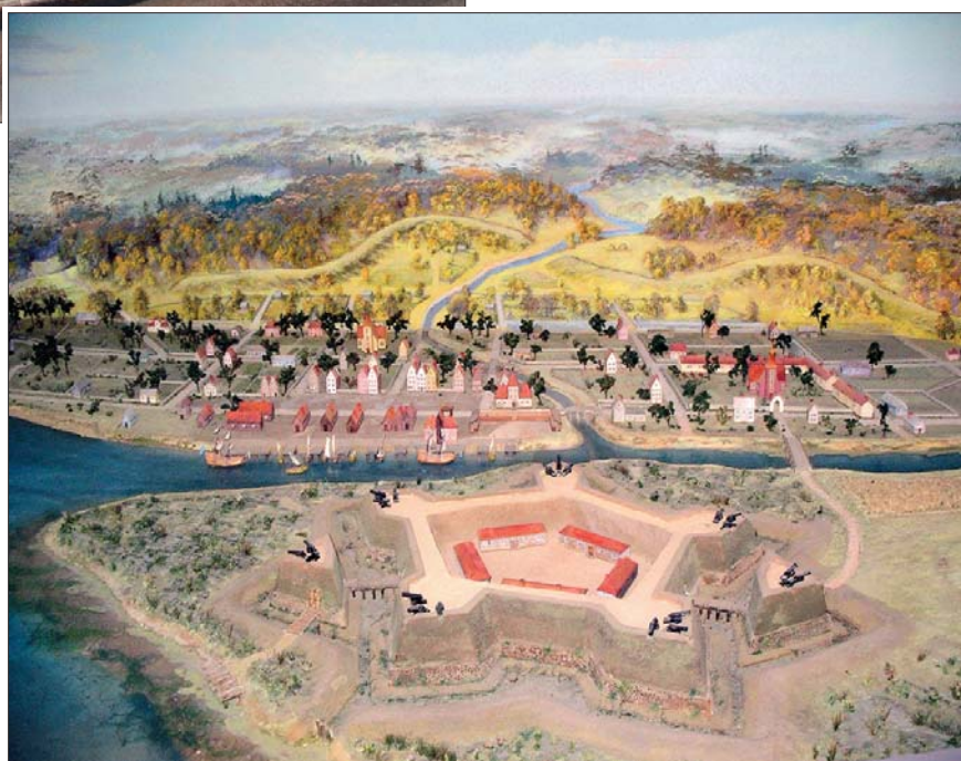
Макет крепости Ниеншанц и города Ниен в музее «Ландскрона, Невское устье, Ниеншанц», 2003-2007 гг.