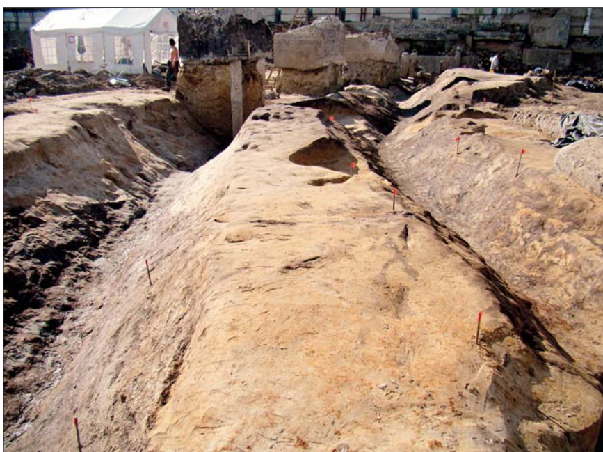
Ров мысового городища и канава с частоколом XIII в.

детельства этому — обнаруженные здесь остатки деревянных конструкций, связанных с промысловой и хозяйственной деятельностью человека. Прекрасно сохранились разнообразные каменные орудия, изделия из коры, набор янтарных украшений, а также многочисленные фрагменты — орнаментированной глиняной посуды, рыболовных ловушек, сделанных из колев и планок. Поселение, названное нашими специалистами «Охта 1», по своим масштабам и сохранности остатков деревянных конструкций входит в число редчайших объектов на территории Северо-Восточной Европы.