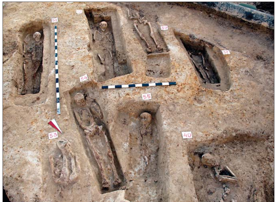
Захоронения из могильника на левом берегу Охты.

Согласно шведской хронике, флот с войском в количестве 1100 человек возглавлял королевский наместник Тергильс Кнутсон. По завершении строительства, как отмечает летописец, между двумя реками был вырыт ров, над ним стояла стена с восемью башнями с бойницами, а за ними — все войско. После отплытия флота в Ландскроне остался гарнизон численностью 300 человек.